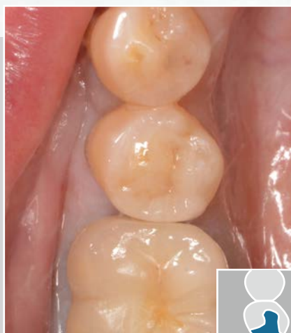
修復部位：下顎5番00インレー 使用インゴット：AHT A1