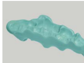
ナイフによるトリミング