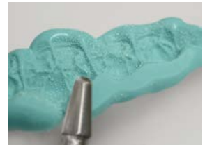
切削バーによるトリミング