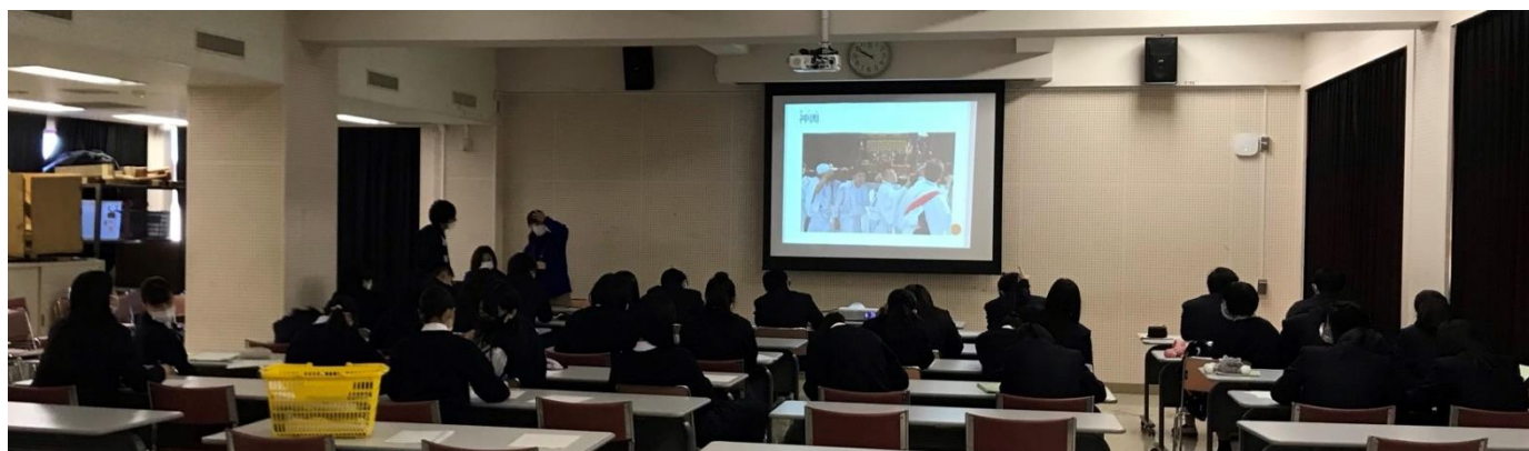
(檜原村の講演の様子)