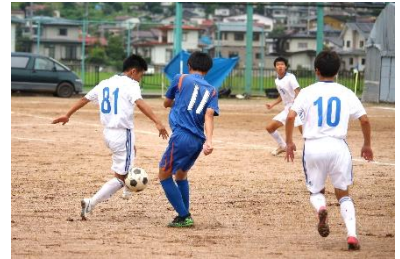
サッカー競技の様子 →