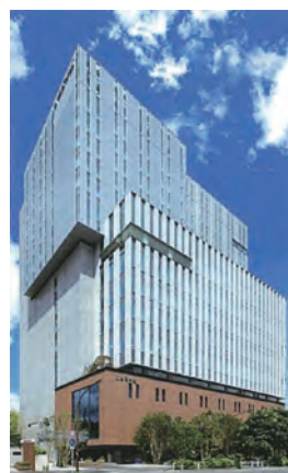
◁日本青年館の外観 (宿泊は日本青年館ホテル)

認定NPO法人 きらめき未来塾 電話 03-6454-0114 FAX 03-3226-7618