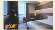
△日本青年館ホテルの客室