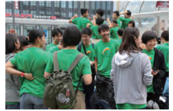
はじめまして！ 集合場所で懇談（2017年）

認定 NPO 法人きらめき未来塾の「夏季合宿研修」は、都道府県の教育委員会から、都道府県の高等学校にご連絡いただき、入塾される高校生の選抜は高等学校にお願いしております。ただ近年は当塾のホームページをご覧になった高校生が直接お申し込みになるケースもあり、お受けする場合があります。この案内書をご覧になり、入塾を希望される高校生は、まず別紙の申込書にご記入いただき、FAX でお送りください。その上で改めて当塾の事務局から連絡いたします。