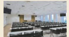
△日本青年館の研修室