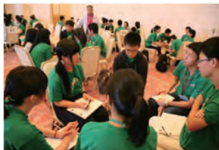
グループ別ディスカッション（2017年）

参加される君たちには、ぜひとも、このまたとない機会を生かし、いつか必ず訪れる「天の時」までに大いにリーダー力を涵養して頂きたいと思います。