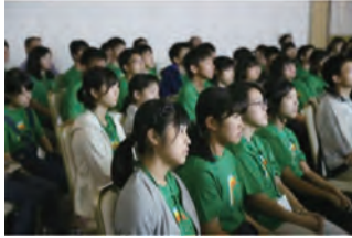
講義に集中する塾生（2017年）

今、君たちの心には、どんな大志が静かに「天の時」を待っているのでしょうか。きらめき未来塾は国際社会、日本、地域社会で活躍する有能な人材の発掘と、将来の日本を支えるリーダー育成を目的とし、2005年に私のふるさと・広島県庄原市を皮切りに、合宿研修として毎年夏季に開塾してきました。