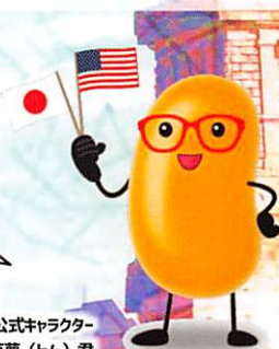
米国大使館公式キャラクター 豆夢 (トム) 君

EducationUSA は 世界 170 か国で 米国留学に関する情報を 提供しています。