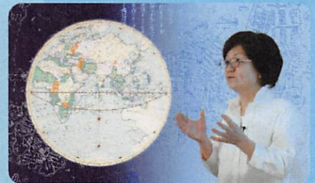
江戸時代の人びとは世界をどのように見ていたのだろうか 岩崎 奈緒子 総合博物館教授