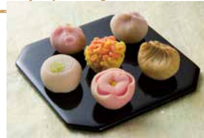
每個季節的特製糕點