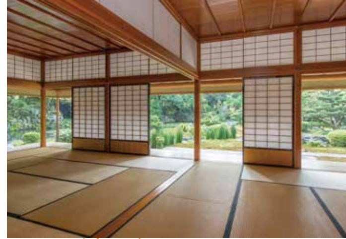
從復原間望見庭園

加賀藩5代藩主・前田綱紀於1676年(延寶4年)將建築工程部移至城內，在其遺址上建造蓮池御亭及周圍的庭園。此即為兼六園的前身。6代藩主・吉德對御亭進行改建，而在藩政後期稱之為時雨亭。當時的時雨亭建於現在的噴水處之前，而後於明治初期被拆除。2000年(平成12年)3月在現址完成重建。庭側的10疊、8疊以及其圍邊為依據遺留下的當時的平面圖進行復原的部分。