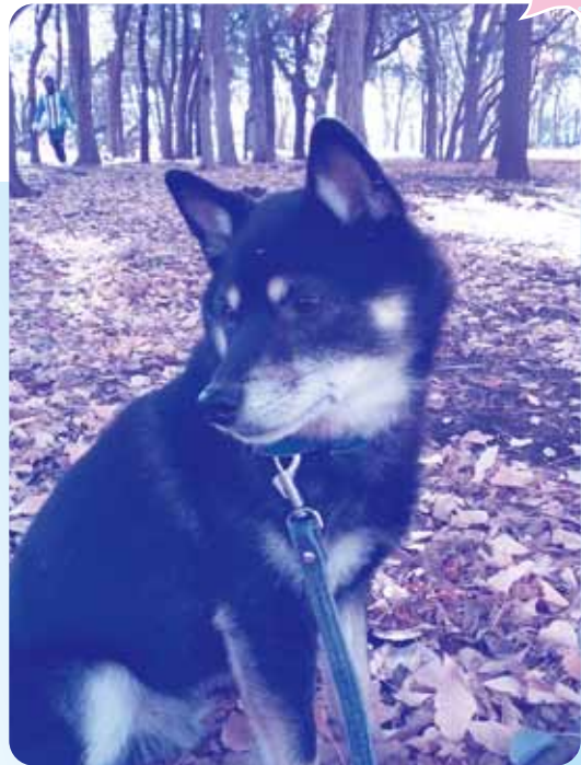
(お父さんがマルハニチロ物流で働いている利助君です!)

小型の柴犬“豆柴”の利助、七歳です。 柴犬は忠誠心と強さのイメージが強い和犬です。 童謡にも雪の積もる時に庭を駆けるタフさが 取り上げられているくらいですね。 ♪犬は喜び庭かけまわり、猫はこたつで丸くなる♪ 利助と雪道を散歩しようとしたときだ。 歩こうと前足を上げたが、雪を見て止まってしまった。 雪が苦手ようだ。 利助は“柴猫”という新種の犬なのかもしれない。