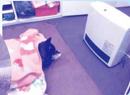
冬はガスヒーターに限る