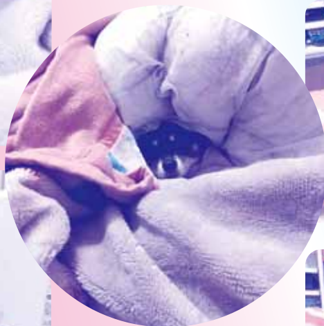
どんどん奥に入る