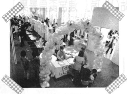
とつかお結び広場の様子