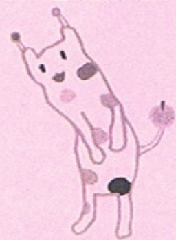
戸塚区のマスコット ウナシー