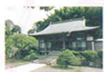
らいこうじ 來迎寺 浄土宗 矢部町947

開山は弘法大師と伝えられている。建立場所は吉田町字大日谷(現戸塚税務署付近)寺院名を「東高野」。その後寺名は「東峰山・光圓寺」更に「東峰山・金剛寺」としその本堂を寶藏院とした。寛文2(1662)年戸塚駅東口付近に移り、その後昭和18年に現在の地に移った。