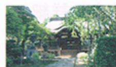
しんねんじ 親縁寺 時宗 戸塚町464