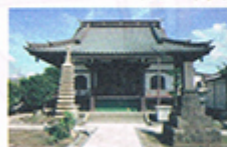
みょうしゅうじ 妙秀寺 日蓮宗 吉田町1034