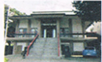
ほうぞういん 寶藏院 真言宗大覚寺派 吉田町935