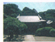
こうしょうじ 高松寺 臨済宗圓覺寺派 戸塚町4846

創建は貞治2(1363)年圓覺寺塔頭黄梅院2世による。戸塚宿設置の功労者澤辺信友(澤辺本陣初代当主)により中興される。信友の子古汎(こはん)は黄梅院の当主となり圓覺寺の宗旨改革を行った。豊臣秀頼の娘・天秀尼に禅を教えたのが古汎である。古汎は左甚五郎とも付き合い山門龍の彫刻は甚五郎作。梵鐘は、昭和40年代まで夕べの時の鐘として親しまれていた。