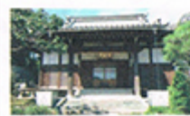
かいぞういん 海蔵院 臨済宗圓覺寺派 戸塚町4213