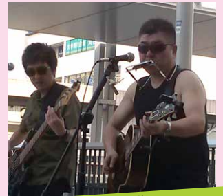
ザ オイナリサン THE OINARI3 フォークロック ♪いつかアナタと TOTSUKA