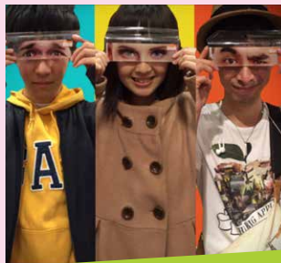
ハイソールリブレ ポップス ♪君の住む街へ