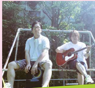
ムーンライトディーアール Moon Light Dear アコースティックロック ♪5 番乗り場