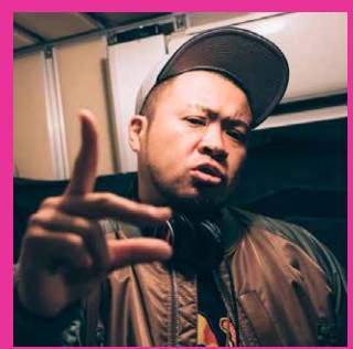
サイプレス上野 他