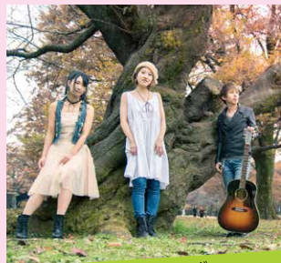
ブリリアントブリング brilliant x bring ポップス ♪光照らす場所