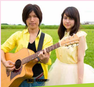
クローバー Clover ポップス ♪さくら道