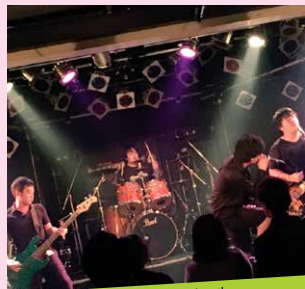
ニューパーティールール New Party Rule ロック ♪とつかのうた